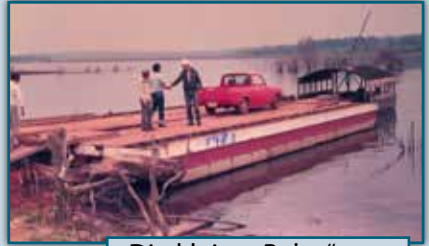
Die kleine „Balsa“ war später die Misericordia